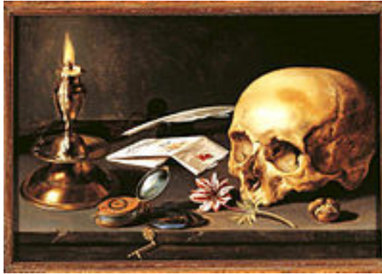
Pieter Claesz, Vanitas – martwa natura

Motyw marności (łac. vanitas), związany z fascynacją przemijaniem i śmiercią, najbardziej widoczny był w sztuce i literaturze średniowiecza oraz baroku. Motywy vanitatywne miały uświadomić odbiorcy, że radość życia to tylko przemijająca chwila, trwająca jedynie przez moment, a wszystkich i tak czeka śmierć. Marność najczęściej przedstawiana jest przez wiele symboli, np. czaszkę, klepsydę, zegar, gnijące owoce, lustro czy kwiaty.