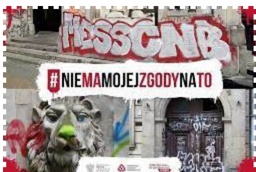
Plakat kampanii Narodowego Instytutu Dziedzictwa