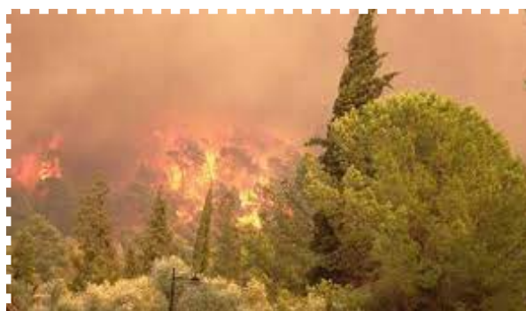
Pożar w Grecji