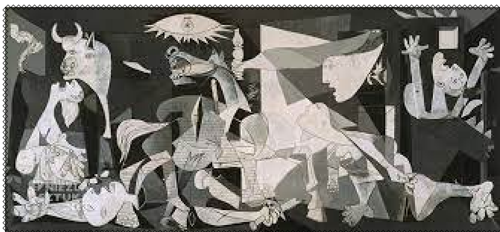
Guernica , Pablo Picasso