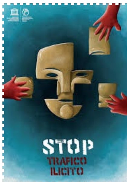
Plakat kampanii UNESCO