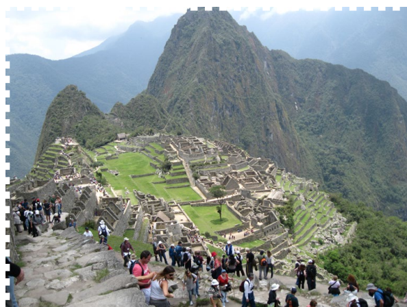
Machu Picchu, Peru