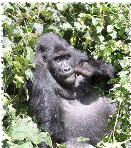
Goryl z jednego z afrykańskich parków narodowych