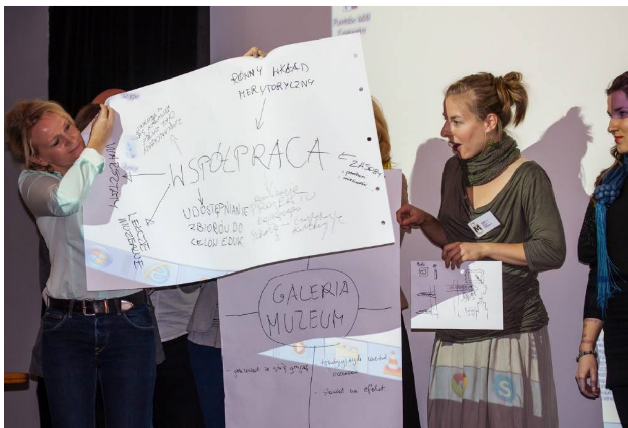
Foto: Muzeum Narodowe w Warszawie – konferencja dla edukatorów kulturowych, 2018

· Zaproponowane scenariusze, jako przykładowe, pokazują, jak można uczyć przez twórczość i sztukę przy użyciu szerokiego wachlarza środków nawet przy ograniczonych przez pandemię możliwościach.