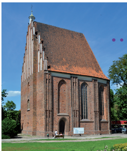
Ryc. 5. Kościół Najświętszej Marii Panny in Summo, fot. archiwum CTK TRAKT.

Zawalenie się wieży katedralnej i zniszczenie Kaplicy Królewskiej.