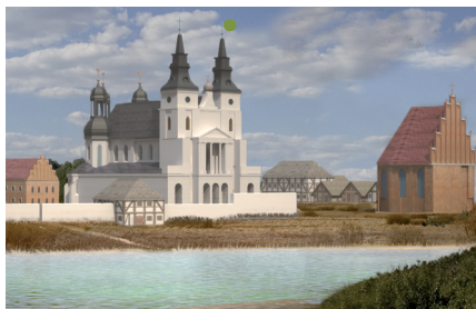
Ryc. 8. Katedra klasycystyczna, rys. P. Walichnowski.

Zawalenie się wieży południowej katedry i zniszczenie sąsiadujących kaplic i portalu.