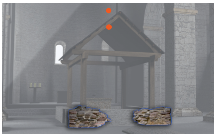
Ryc. 2. Grobowiec Bolesława Chrobrego, rys. P. Walichnowski.

Pochówek księcia Polski Kazimierza Odnowiciela w katedrze poznańskiej.