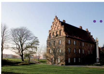
Ryc. 6. Psalteria na Ostrowie Tumskim.

Objęcie biskupstwa przez Jana Lubrańskiego i przekształcenie przez niego Ostrowa Tumskiego w ważny ośrodek kultury i nauki renesansowej. W ciągu dwóch dekad przeprowadził m.in. generalny remont katedry, odnowił pałac biskupi, zaopatrzył wyspę w wodociąg i brukowane ulice.