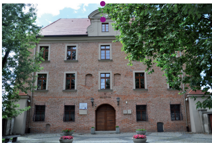
Ryc. 7. Dawna Akademia Lubrańskiego – obecnie Muzeum Archidiecezjalne, fot. archiwum CTK TRAKT.

Powstanie w gmachu Akademii Lubrańskiego Drukarni Akademickiej, w której do jej zamknięcia pod koniec XVIII wieku wydano 700 druków.