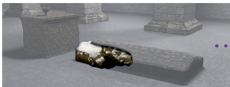
Ryc. 1. Grobowiec Mieszka I, rys. P. Walichnowski.

Śmierć księcia Mieszka I i jego pochówek na Ostrowie Tumskim.