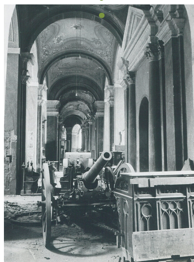
Ryc. 10. Zniszczenia wojenne we wnętrzu katedry – 1945 r., fot. ze zbiorów Miejskiego Konserwatora Zabytków w Poznaniu.

Ostrzał artyleryjski niszczy dach katedry, wieże z dzwonami, organy, ołtarz główny i całe wyposażenie głównej nawy. W trakcie walk o Festung Posen zniszczone lub uszkodzone zostają wszystkie budynki na Ostrowie Tumskim.