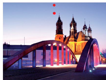
Ryc. 11. Most biskupa Jordana, fot. Z. Schmidt.

Otwarcie Rezerwatu Archeologicznego na Ostrowie Tumskim.